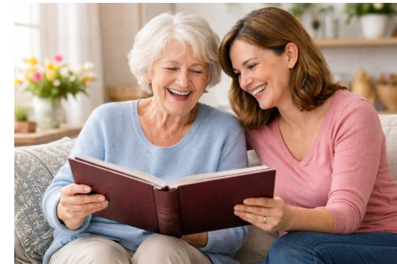
Ki generiert