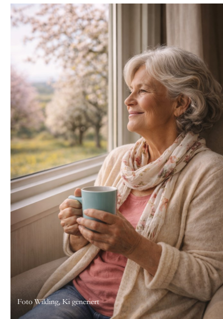
Ki generiert