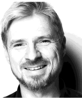
Michael Hagedorn, Fotograf

Wir eröffnen die Ausstellung mit Herrn Hagedorn am 11.03.2022 um 18:00 Uhr im Bornscheuerhaus